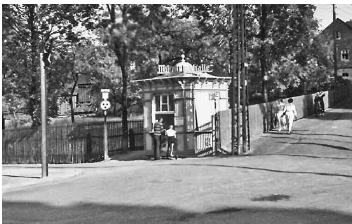
Milchtrinkhalle Oberschlema, Juni 1935