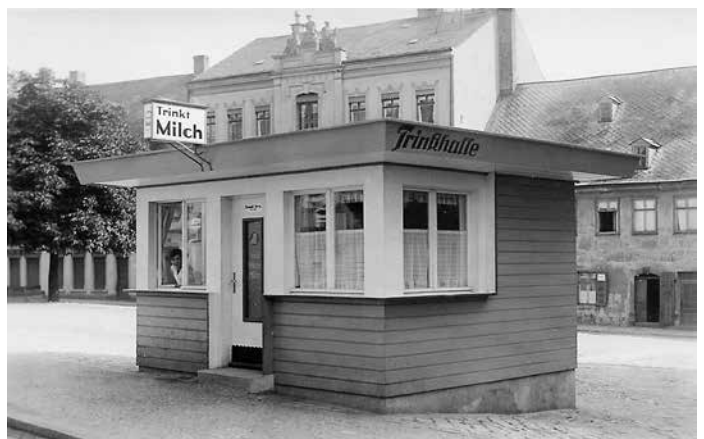
Schneeberg, Milchtrinkhalle am Fürstenplatz, um 1935