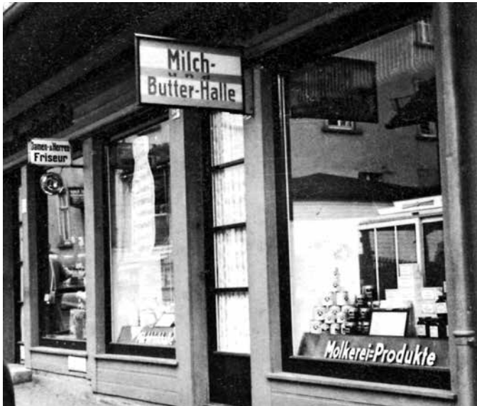
Milchtrinkhalle in den hölzernen Kolonnaden am Kurhaus, 1933

Eine Erscheinung der Gesundheitsreformbewegungen des beginnenden 20. Jahrhunderts waren die damals in der Öffentlichkeit weit verbreiteten Milchtrinkhallen. Diese konnte man auch in den meisten Kleinstädten finden. Errichtet wurden sie an Stellen, an denen ein größerer Publikumsverkehr zu erwarten war, also an Straßenkreuzungen, Plätzen und an Parkanlagen. Besonders in den Städten gab es kaum die Möglichkeit, bei Durst etwas zu trinken, ohne eine Gastwirtschaft aufsuchen zu müssen. Das Leitungswasser durfte nur abgekocht getrunken werden. Flaschenbier, Selters und Limonaden gab es nicht einfach so zu kaufen, sondern wurden von den Händlern ausgeliefert. Als ein gesundes und sättigendes Angebot galt damit das Trinken frischer Milch. Der hohe Kalziumgehalt, so die Werbung, stärkt Zähne und Knochen, Jod und Vitamine fördern die Gesundheit und die Proteine unterstützen den Aufbau von Muskeln und animieren das Wachstum von Kindern und Jugendlichen. Gefördert wurde der Gedan-