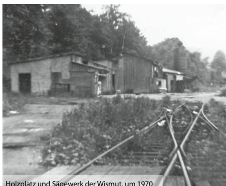
Holzplatz und Sägewerk der Wismut, um 1970

Noch um 1970 war der Fahrzeugverkauf auch im Bezirk Karl-Marx-Stadt völlig unzureichend organisiert: In normalen innerstädtischen Geschäftshäusern standen die wenigen Fahrzeuge hinter den Schaufenstern und wurden dann umständlich auf die Straße gebracht. In den viel zu engen Räumlichkeiten musste die gesamte Büroarbeit hinter kleinen vollgepackten Schreibtischen abgewickelt werden, vor denen sich die Kunden drängten. Die Fahrzeuge waren zig Kilometer über holprige Landstraßen herangeführt worden und hatten beim Verkauf schon einiges auf dem Tacho. Die erste Durchsicht erfolgte noch im Hinterhof. Gewaschen wurde das Fahrzeug mit der Hand vor den Augen der Passanten auf der Straße. In Aue verkaufte der Autohandel den Shiguli, Moskwitsch und Wartburg; in Schneeberg den Saporoshez und Trabant. Nun suchte der staatliche Autohandel ein Gelände für ein zentrales modernes Autohaus.