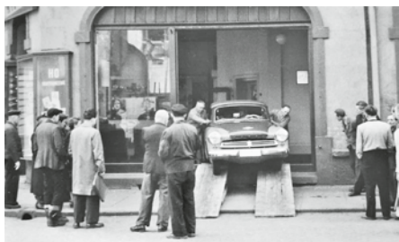
Pkw-Auslieferung in Aue, um 1965

In den 1960er Jahren erlebte die Motorisierung auch in der DDR einen enormen Schub. Immer mehr Kraftfahrer stiegen von den Zweirädern auf Vierräder um, da Pkw's zunehmend erschwinglicher wurden. Außerdem forderte die immer größer werdende Zahl an Familien eine „Familienkutsche“ – die geburtenstarken Jahrgänge standen gerade an. Noch konnte der staatliche Autohandel, der im „Industrieverband Fahrzeugbau der DDR“ (IFA) organisiert war, den Bedarf gerade so decken, aber auch nur, da die DDR immer mehr Fahrzeuge aus den „sozialistischen Bruderländern“ importierte. Den Anfang machten Mitte der 1960er Jahre die Skodas aus der CSSR und die Shigulis, Saporoshez' und Moskwitschs aus der UdSSR. Noch betrug die Wartezeiten nur wenige Wochen, doch das sollte sich bald dramatisch ändern.