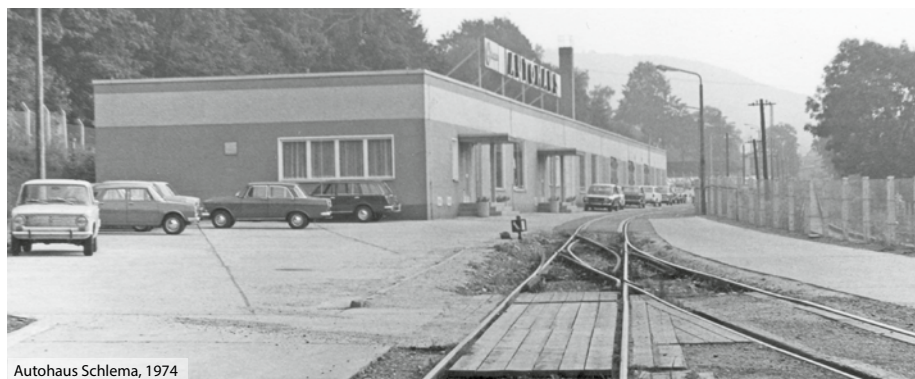
Autohaus Schlema, 1974