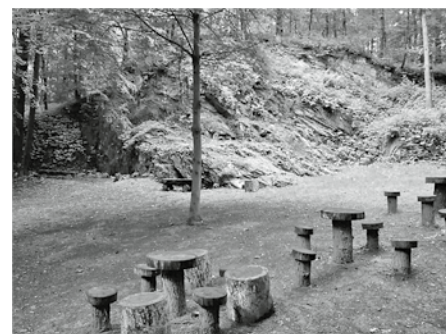
Blick auf den Pfarrfelsen

Der Bergbau auf Eisenerz kam in Gänge. Das Erz wurde sowohl Übertage, z. B. am Pfarrfelsen, als auch Untertage abgebaut. Untertage wurde Eisenerz vom Ufer der Mulde aus abgebaut. Der heute noch gebräuchliche Flurnamen „Stollen“ weist darauf hin. Hier hatten auch Prinz Ernst und die sogenannten „Prinzenräuber“ ihr Versteck. Am rechten Ufer des Wildbaches unterhalb der Burg findet man noch Stollen aus der Zeit des Altbergbaus.