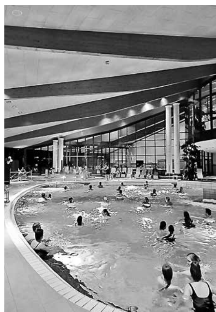
Stimmungsvolles Aqua-Zumba zur Wiedereröffnungsparty im ACTINON

Als ein weiterer Höhepunkt für die Gäste erwies sich eine Autogramstunde mit dem