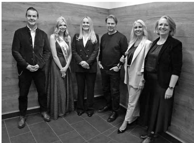
Der Schauspieler Kai Schewe nahm am 23. November an einer Talkrunde in Bad Schlema teil

Schwimmerbecken im Außenbereich, das neue Therapiebecken für Gäste mit Handicap und Gruppentherapie, das neue Sauna-Ruhehaus, die modernisierte Badelandschaft im Innen- und Außenbereich sowie den modernisierten Duschen- und Umkleidebereich. Insgesamt wurden bis jetzt 18 Millionen Euro in die Modernisierung und Erweiterung des Gesundheitsbades ACTINON investiert. Diese Modernisierungsmaßnahmen werden mitfinanziert mit