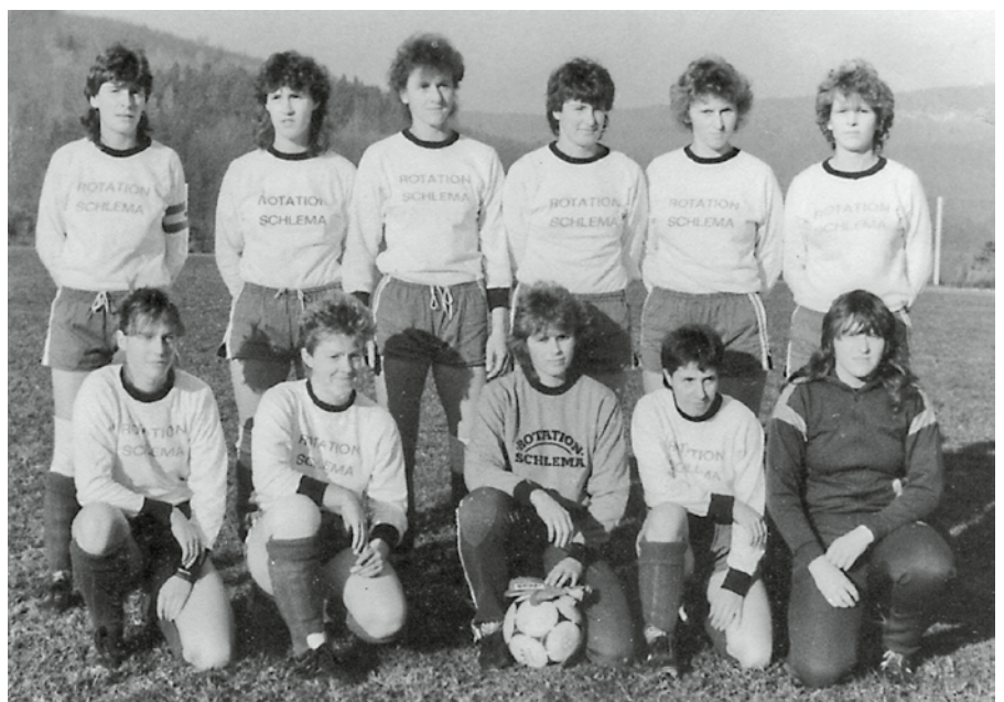
Rotation Schlema, um 1988