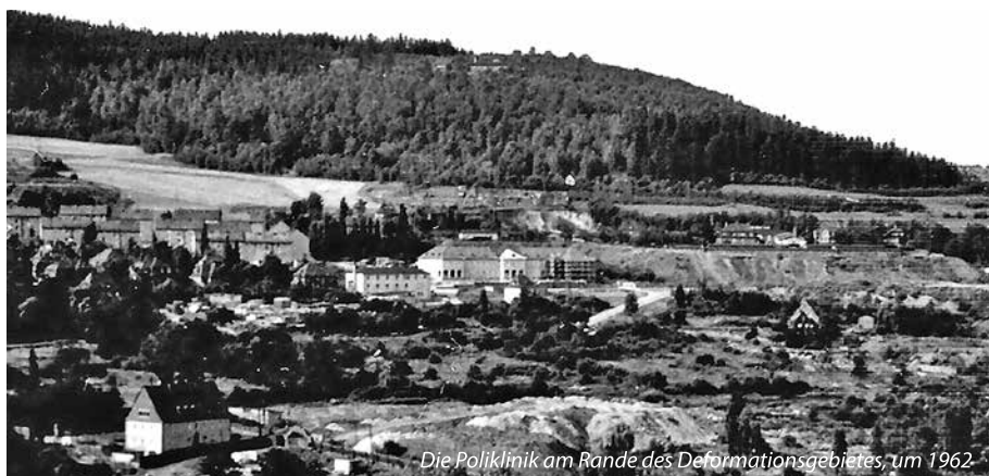
Die Poliklinik am Rande des Deformationsgebietes, um 1962

sind bis Ladenschluß da. Ihnen gefällt unsere Gesundheitswerkstatt. In der Chirurgie geht es schnipp-schnapp, beim HNO wird in der Nase gebohrt, aus dem Labor steigt ein Duft nach