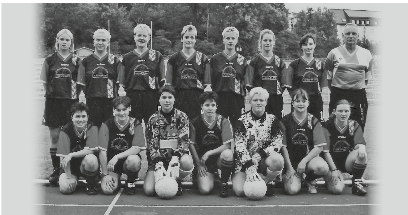
FC Wismut Aue, um 1998