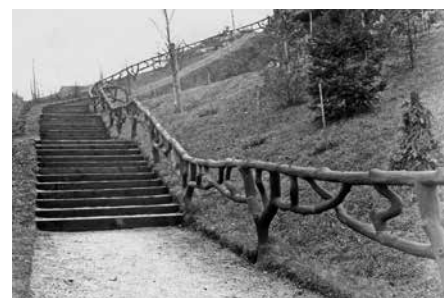
Geländer in den Hammerberg-Anlagen, 1932