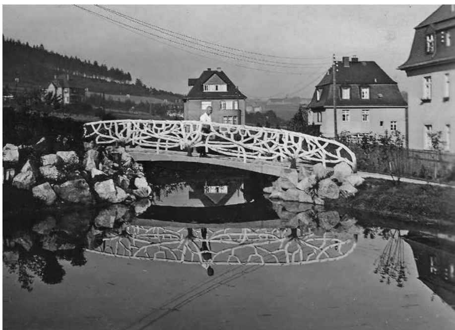
Brücke am Goldfischteich, Sommer 1932

Als eine letzte ihrer Art in Sachsen zierte nun schon seit über 90 Jahren eine Monier-Brücke die Parkanlage im ehemaligen Fremdenheimviertel in Oberschlema. Sie wurde 1932 neben einer Reihe anderer Monier-Elemente in den Oberschlemaer Kuranlagen errichtet. Die Möglichkeit, Brücken dieses Typs zu bauen, geht auf eine Erfindung des französischen Unternehmers Joseph Monier zurück, der schon Mitte des 19. Jh. mit Eisen und Beton in Kombination experimentierte. Zuerst entstanden Wasserbehälter, später Brücken und Skulpturen. Der die Zugfestigkeit garantierende Trägerstahl im Beton wird noch heute Moniereisen genannt. Brücken dieser Art entstanden Ende des 19. Jh. in Frankreich, bald auch in Deutschland. Um die Jahrhundertwende wurde es bald Mode, in Parkanlagen kleine Lauben, Geländer und Wegebegrenzungen aus Baumknüppeln, vorzugsweise aus heller Birke, aufzustellen. Doch diese hielten naturgemäß nicht lange. So ging man dazu über, diese Bauteile aus Rocaille-Beton zu fertigen. Dazu wurde über das Bewehrungsseisen der Beton so modelliert, dass er Baumstäben ähnlich sah. Abschließend erhielten die geformten Teile einen wetterfesten Anstrich. Bei guter