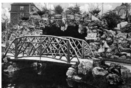
Brücke an der Grotte, 1933