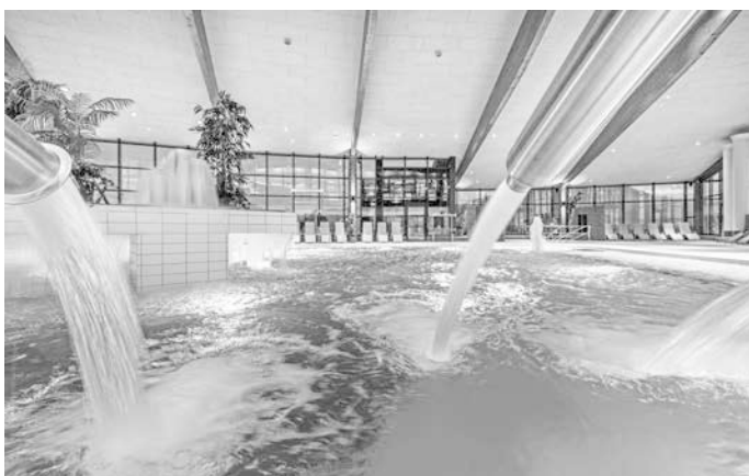
Modernisierte Badelandschaft im Gesundheitsbad ACTINON

Das Badcafé hat sowohl für die Gäste der Bade- und Saunalandschaft, als auch von öffentlicher Seite aus nun täglich von 11 bis 20 Uhr geöffnet.