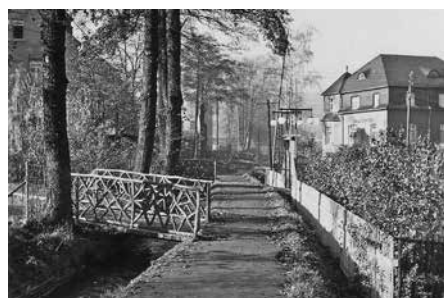
Brücken an der Flößgrabenpromenade, 1933