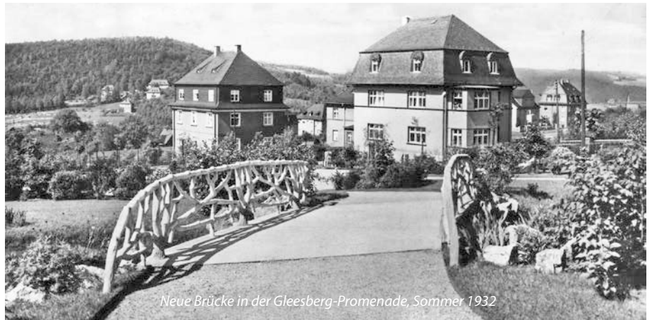
Neue Brücke in der Gleesberg-Promenade, Sommer 1932