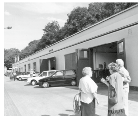
Neustart, September 1992